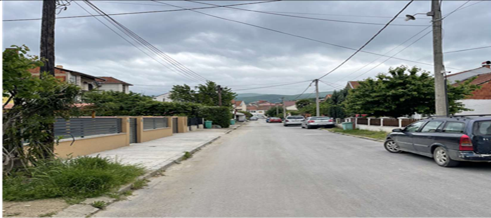
Фотографија бр. 1: Изведба на втор слој асфалт на улица „Мануш Турновски“