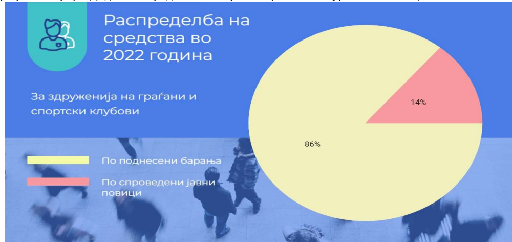
Графикон број 1: Доделени средства по барање и јавни конкурси или повици

Во однос на начинот на реализација на програмите ги утврдивме следниве состојби: