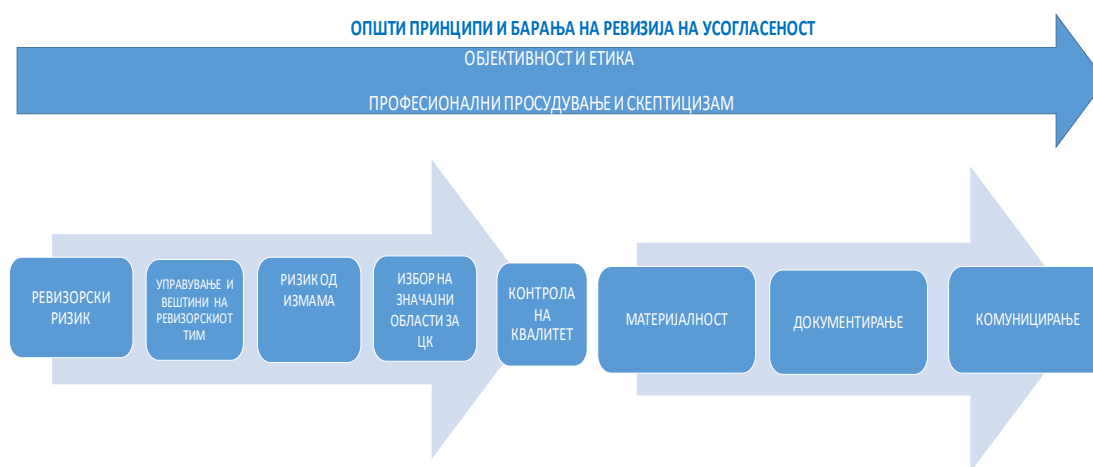
Слика 4. Општи принципи и барања на ревизија на усогласеност

Слика 4 подолу и се детално појаснети во ISSAI 400, Глава 5, точки 43 – 49 и ISSAI 4000, Глава 5, точки 45 – 100.