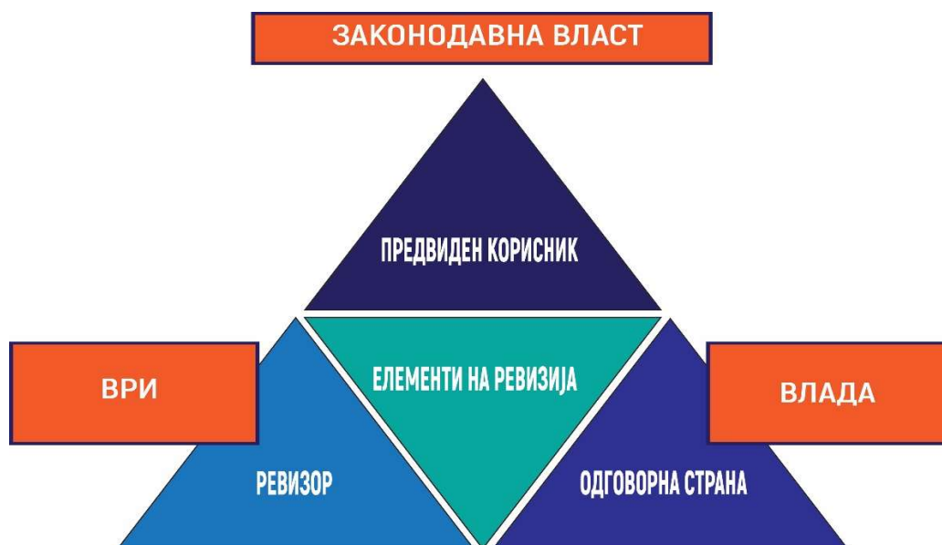
Слика бр. 1 Трите страни во ревизијата на усогласеност