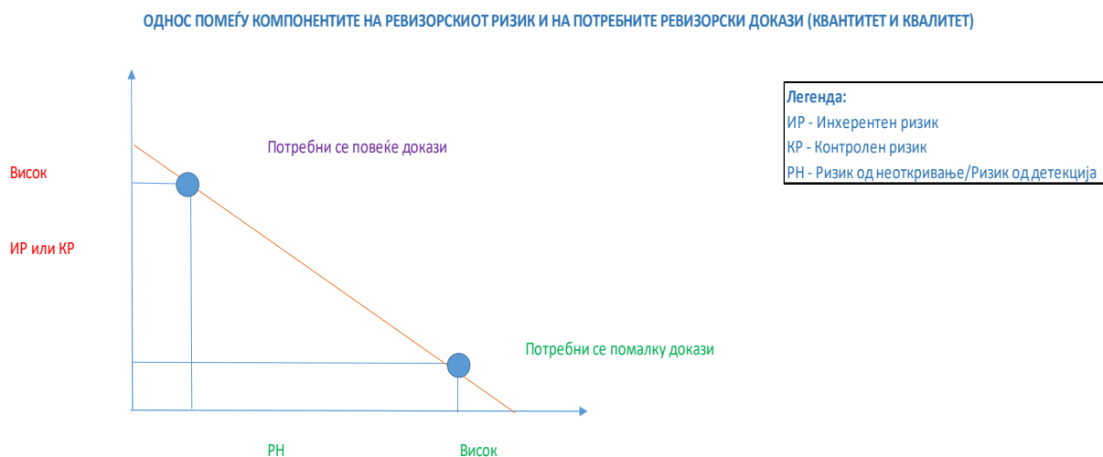
Слика 7. Однос помеѓу компонентите на ревизорски ризик и потребните ревизорски докази (по квантитет и квалитет)

Односот помеѓу компонентите на РР и потребните ревизорски докази кои ревизорот ќе ги обезбеди во тек на фазата на вршење на ревизијата е претставен подолу на Слика 7. Односот покажува дека кога проценката на инхерентниот и контролниот ризик за ревизорот укажува дека тие се високи и дека не може да се потпре врз нивната оперативност (забелешка – ова е од особено значење кај контролниот ризик затоа што високиот ризик кај КР покажува слаби или отсуство на функционирање на системите на внатрешни контроли кај субјектот кој е предмет на ревизија) тоа значи дека ревизорот ќе дизајнира во ревизорските програма и план повеќе ревизорска работа по обем и по опфат и квалитет, односно ќе спроведе поголем број на тестови и аналитички постапки со кои ќе го сведе ризикот од неоткривање или ревизорскиот ризик во целина 52 на доволно ниско ниво за одредување на видот на мислењето или заклучокот по извршената ревизија.