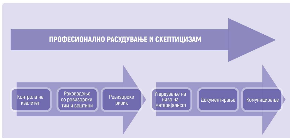
Слика 2. Професионално расудување и скептицизам

Ревизорот одржува став на професионален скептицизам со цел да биде внимателен на условите, околностите и информациите што може да укажуваат на постоење на материјална неусогласеност и критички да ги оцени ревизорските докази.