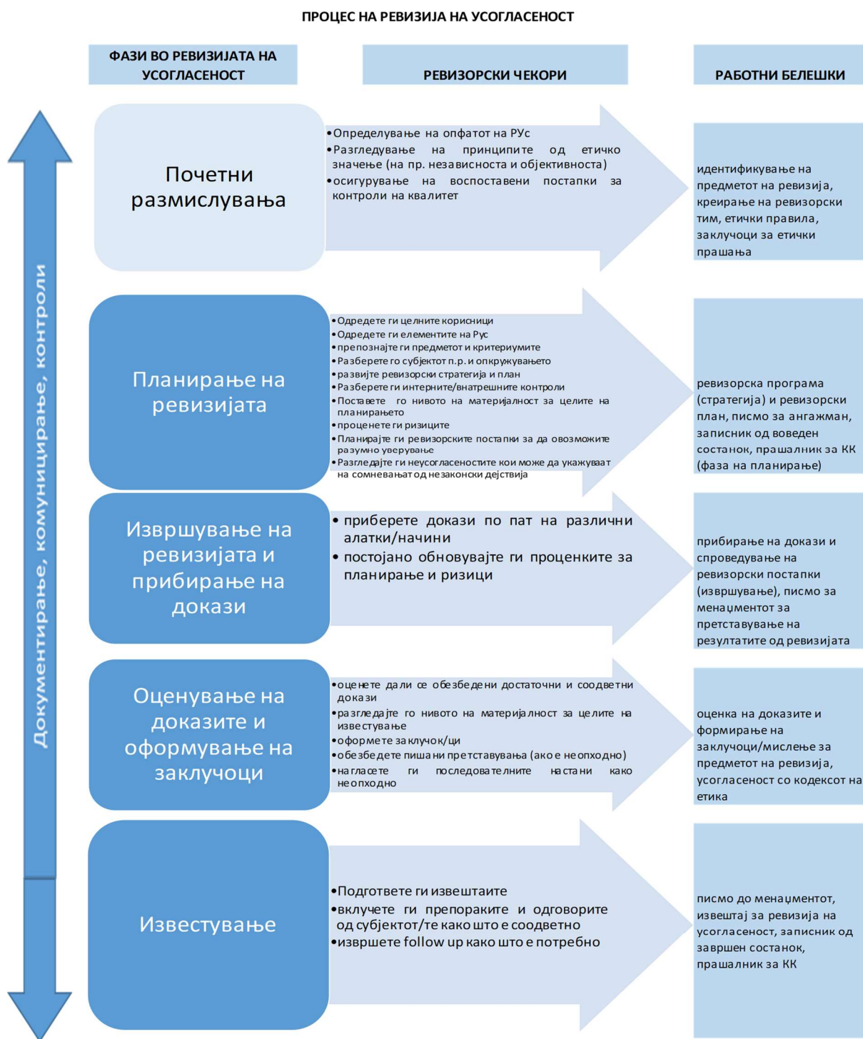
Слика 3 – Процес на ревизија на усогласеност