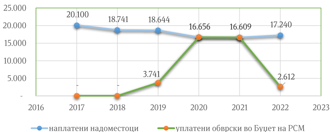
Наплатени надоместоци за користење на вода и за испуштање во води и платени тековни обврски во Буџетот на Република Северна Македонија во периодот 2017 – 2022 година изразени во илјади денари

Со извршениот увид во деловните книги на ЈП Водовод и канализација Скопје, на крајот на 2021 година, ревизорите утврдиле искажани, но не платени обврски спрема Буџетот на Република Северна Македонија, од повеќе години наназад, во вкупен износ од 185.543 илјади денари (околу 3 милиони евра) по основ на надоместок за користење на вода и надоместок за испуштање во води.