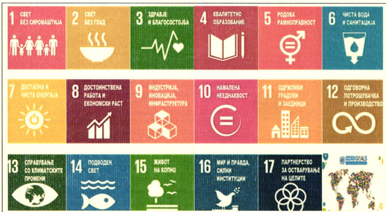
Слика 3: Одржливи развојни цели на ООН – Агенда 2030