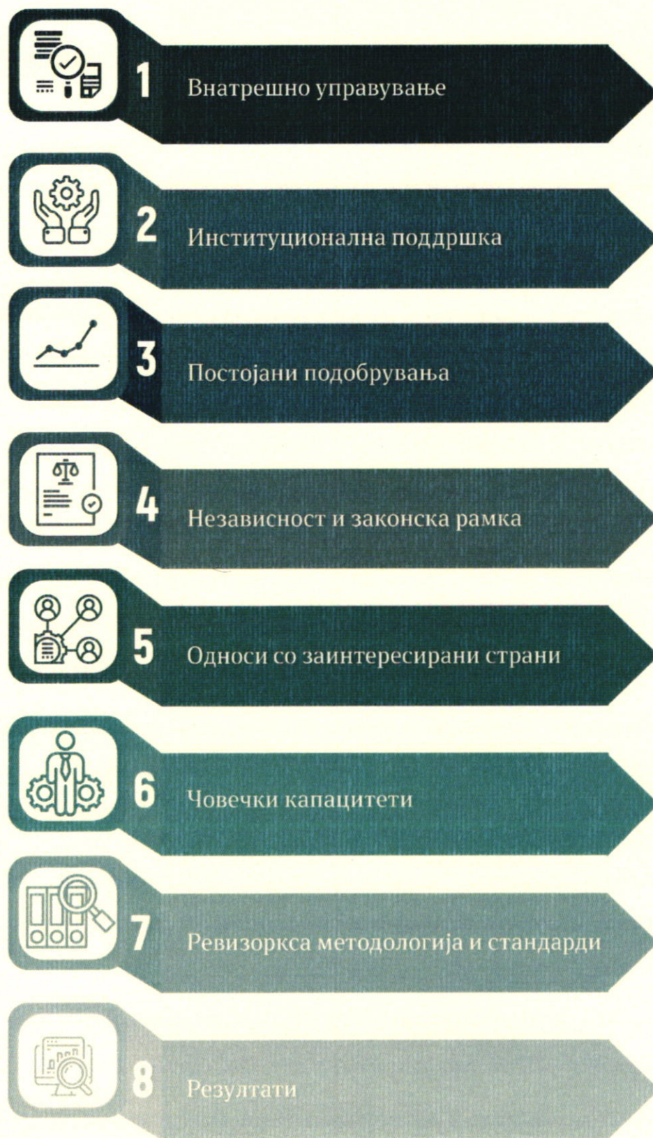
Слика 2: Рамка за градење на капацитети на Врховните ревизорски институции