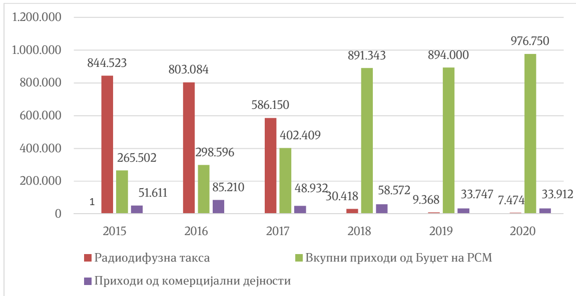
Графикон бр.2 - Структурата на остварени приходи во периодот 2015 – 2020 година

На следниот графикон прикажана е структурата на остварени приходи во периодот 2015 – 2020 година изразена во илјади денари: