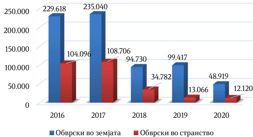
Графикон бр.3 - Обврски спрема добавувачите во земјата и странство во период од 2016 до 2020 година

На следниот графикон прикажани се обврските на ЈРП МРТ во земјата и странство во периодот од 2016 до 2020 година изразени во илјади денари.