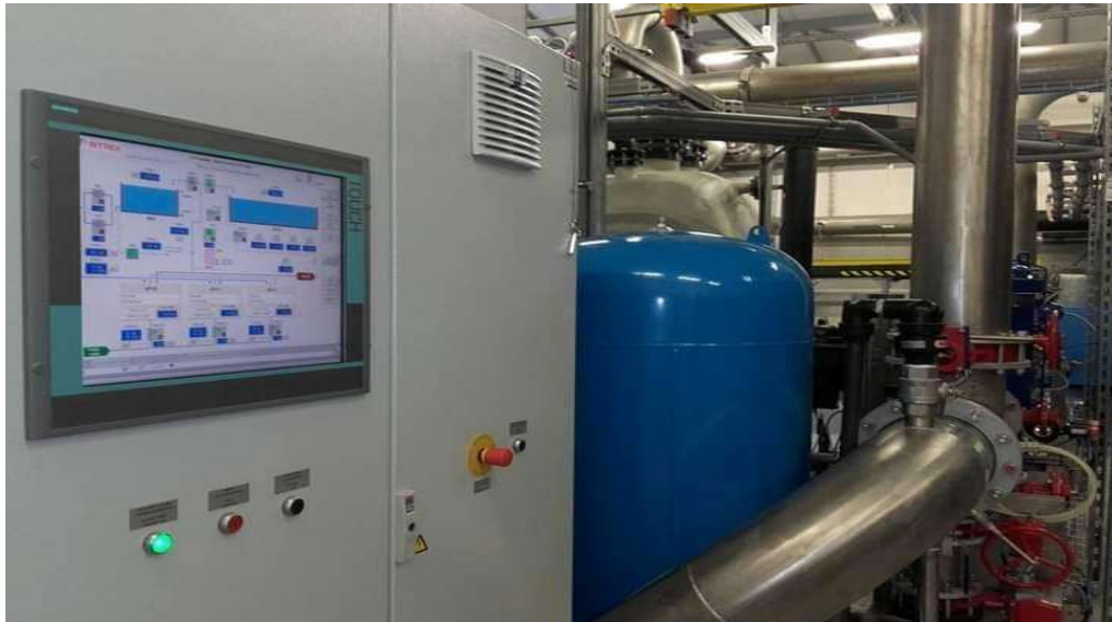
Филтер станица ЈКП „Никола Карев“

задолжување на РСМ со заем кај Јапонската банка за меѓународна соработка по Договор за заем бр. МАС-Р1 од 20.11.2003 година и склучен Договор за под заем 21 помеѓу Влада на РСМ, претставувана од Министерството за финансии и ЈКП „Никола Карев“ Пробиштип на износ од 49.000 илјади денари, со рок на отплата од 17 години, вклучен грејс период од 1 година и 3 месеци и каматна стапка од 1,50% на годишно ниво. На крајот на 2013 година, склучен е Анекс 22 кон договорот, со кој вредноста на договорот се зголемува на 57.098 илјади денари. Отплаќањето на под заемот се врши на две полугодишни рати, почнувајќи од 10-ти мај 2013 година заклучно со 10-ти ноември 2028 година. Со 31.12.2020 година отплатени се 16 рати и останува обврска за плаќање во износ од 30.368 илјади денари. Средствата се искористени исклучиво за финансирање на Проектот за изградба на инфраструктурен објект-фабрика за преработка на вода за пиење (филтер станица).