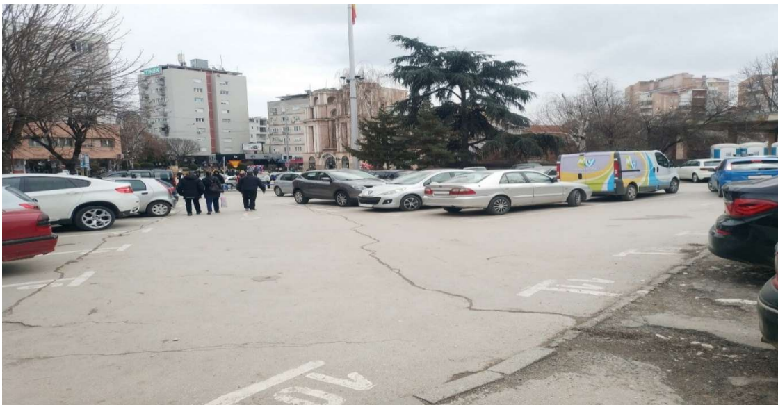
Паркинг - Куманово

Поради недостиг на финансиски средства за реализација на инвестиционите активности, во 2019 година, јавното претпријатие поднело барање до Општина Куманово, Сектор за комунални работи инфраструктура и сообраќај, за изработка на проекти со ревизија за паркирање на подрачјето на Општина Куманово, но од страна на општината не се преземени активности за поддршка и реализација на барањето.