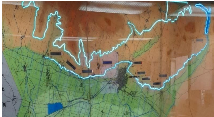
Систем за наводнување - мрежа на ЈП „Стрежево“ Битола

- комплексната инфраструктура на системот за наводнување - мрежа 2 . Деталната цевководна мрежа е распространета на должина од 534 km на која се поставени околу 4.000 хидранти за вода, кои не се контролираат автоматски туку мануелно од страна на сопствениците на земјоделското земјиште;