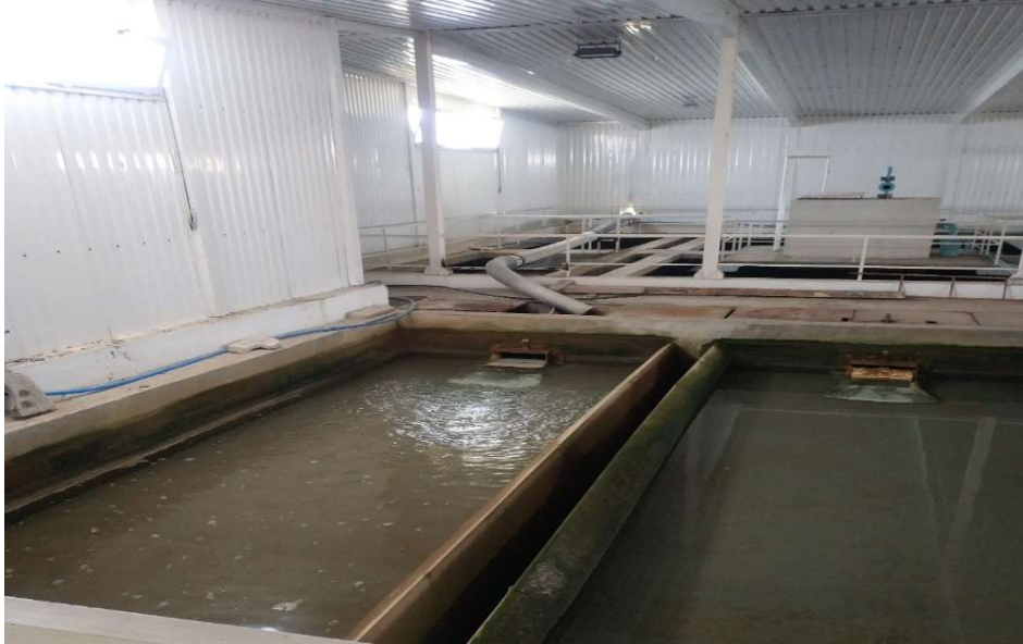
Филтер станица при ЈП „Водовод“ Куманово