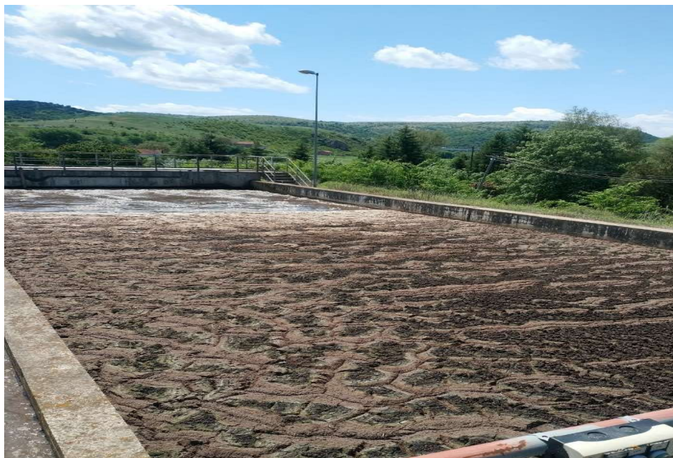
Пречистителна станица при ЈП „Водовод“ Куманово

Општина Куманово во насока на извршување на санација на опремата која со години претпријатието не е во можност да ја сервисира, а со тоа ќе се овозможи и реализација на поголем приход за претпријатието.