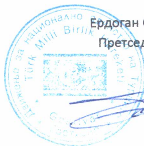
Ердоган САРАЧ Претседател