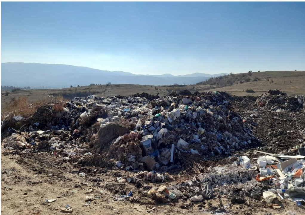
Депонијата во Радовиш

4.2.3. При увид во документацијата која се однесува на обврските на раководниот орган во делот на известувањето идентификувана е состојба на не изготвување на извештај за работата на јавното претпријатие на секои шест месеци, што не е во согласност со одредбите од член 23-а од Законот за јавните претпријатија со кој е регулирано дека директорот е должен на секои шест месеци да доставува извештај за работата на јавното претпријатие до Управниот одбор односно градоначалникот на општината, особено со податоци за видот и обемот на извршените работи согласно дејноста на јавното претпријатие, како и податоци за финансиското работење. Оваа обврска во исто време претставува и одредба од Договорот за уредување на односите со јавното претпријатие во кој поединечно се утврдуваат правата, одговорностите и овластувањата на директорот согласно со закон (менаџерски договор).