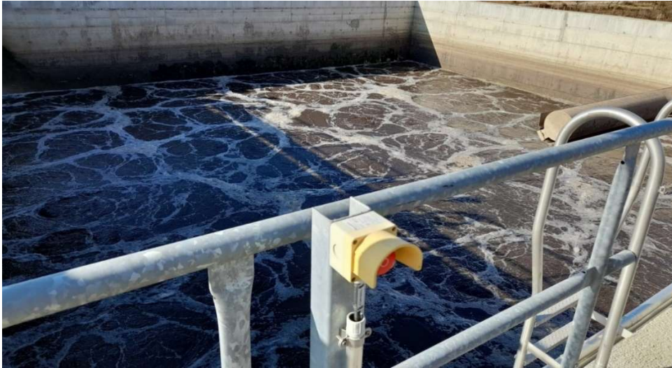
Пречистителна станица за третман на отпадни води Радовиш

4.3.3. Во единствениот трговски регистар и регистарот на други правни лица при Централниот регистар на РСМ, не е извршен упис на основната главнина на ЈП “Плаваја“ Радовиш, што не е во согласност со членот 298 од Законот за трговски друштва каде што е регулирано кои податоци се запишуваат во регистарот. Со Законот за јавни претпријатија, во членот 4-б е уредено дека за упис во надлежниот регистар се применуваат одредбите од Законот за трговски друштва.