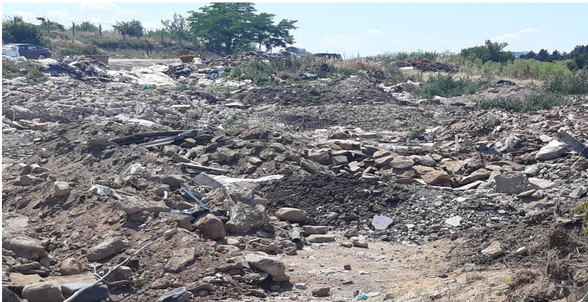
Депонијата во Кочани

4.2.5. При увид во документацијата која се однесува на обврските на раководниот орган во делот на известувањето идентификувана е состојба на не изготвување на извештај за работата на јавното претпријатие на секои шест месеци, што не е во согласност со одредбите од член 23-а од Законот за јавните претпријатија со кој е регулирано дека директорот е должен на секои шест месеци да доставува извештај за работата на јавното претпријатие до Управниот одбор односно Градоначалникот на општината, особено со податоци за видот и обемот на извршените работи согласно дејноста на јавното претпријатие, како и податоци за финансиското работење. Оваа обврска во исто време претставува и одредба од Договорот за уредување на односите со јавното претпријатие во кој поединечно се утврдуваат правата, одговорностите и овластувањата на директорот согласно со закон (менаџерски договор).