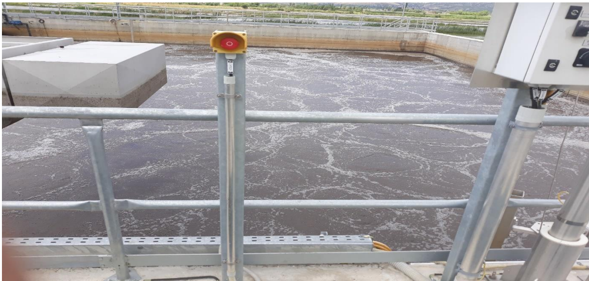
Пречистителна станица за третман на отпадни води

опремата од кои се состои донацијата во вкупен износ од 833.136 илјади денари кој е евидентиран во трговските книги на јавното претпријатие. За остатокот од вредноста на инвестицијата во износ од 180.841 илјади денари не е доставена документација и овој дел не е евидентиран во евиденцијата на јавното претпријатие. Ревизијата смета дека е потребно надлежните органи од јавното претпријатие во соработка со надлежните од општината да ја обезбедат потребната документација во функција на целосно евидентирање на Пречистителната станица за третман на отпадни води.