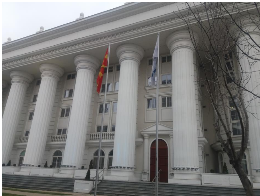
Дирекција на МЕПСО во Скопје

Вработените во МЕПСО во реновиралиот објект се вселија пред неколку месеци, дури 5 години од почетокот на градежните работи. Со оглед на повеќекратното доцнење, досега не е направена пресметка и МЕПСО нема донесено одлука за наплата на казна, ниту наплата на банкарска гаранција за квалитетно извршување на договорот.