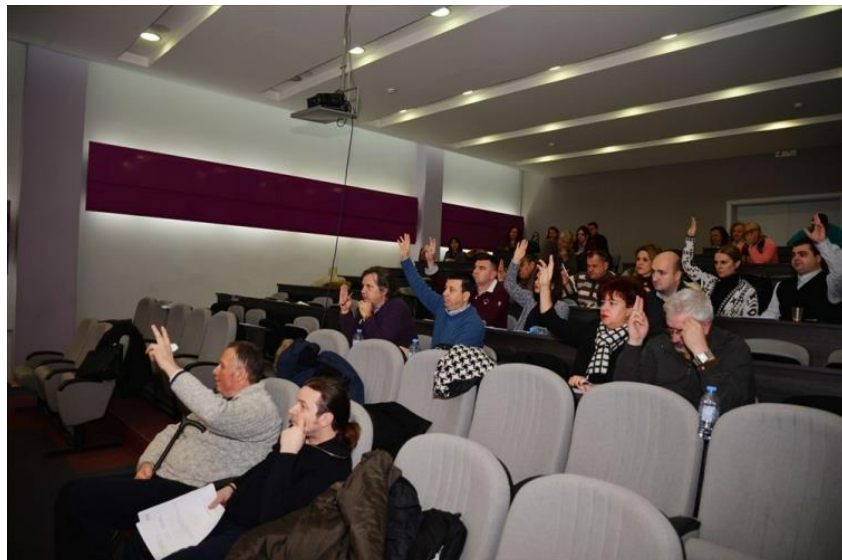
БАДНИК Советниците на Бадник гласаат за промена на ДУП-ови

Законски повреди при изградба на зградата на општина Карпош и ставањето на бари во двор на училиште