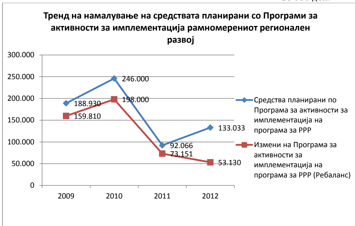
Прилог Графикон бр. 2