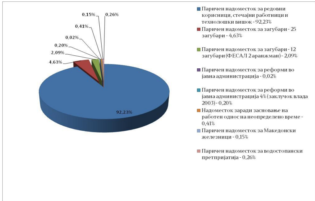
Графикон број 2

Поради големото учество на горенаведените надоместоци (92,23%), ревизијата изврши проверка на функционирањето на постапката за остварување на право на паричен надоместок за редовни корисници, стечајни работници и технолошки вишок, со примена на контроли кои се однесуваат на организацијата и начинот на вршење на работите во постапката, подзаконската регулатива, пишаните процедури, законитоста на остварувањето на правото на паричен надоместок, точноста на пресметката, исплатите и нивно евидентирање.